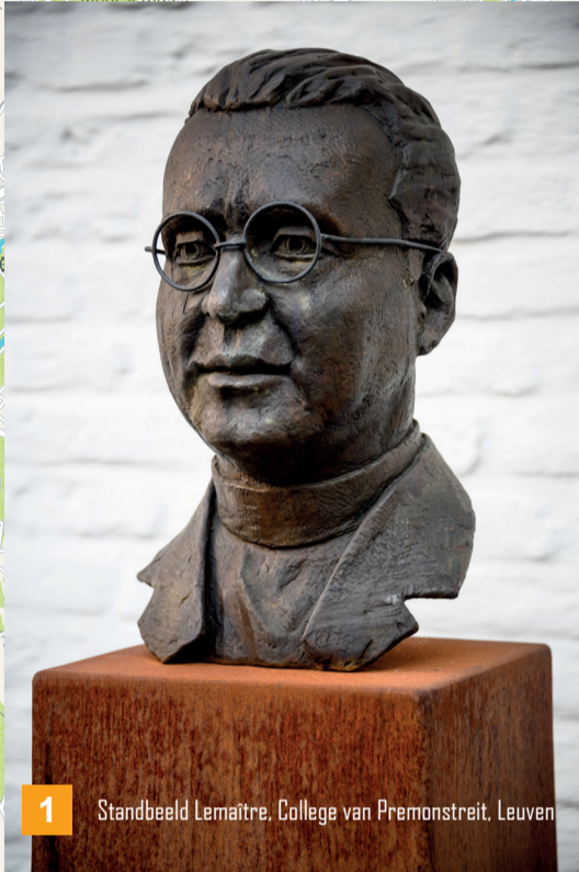
1 Standbeeld Lemaître, College van Premonstreit, Leuven

Fietskaart Vlaams-Brabant - Carte Vélo Brabant flamand - Fahrradkarte Flämisch-Brabant - Cycling Map Flemish Brabant - www.toerismevlaamsbrabant.be/publicaties