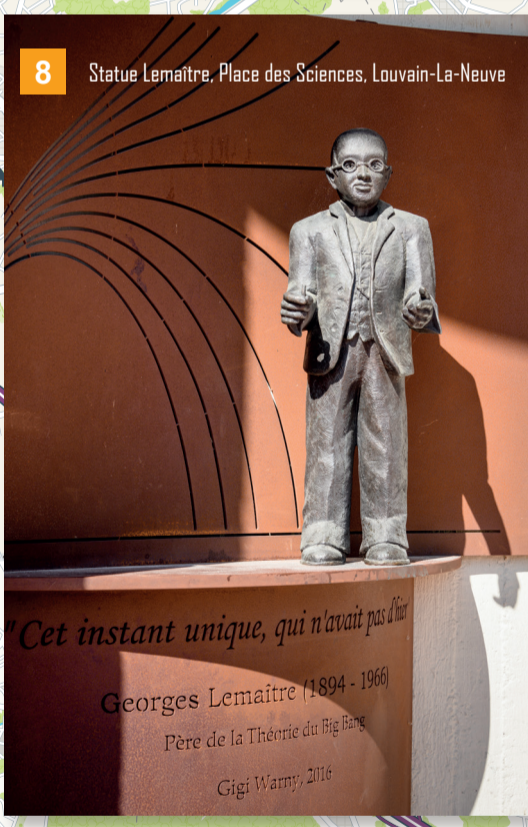
8 Statue Lemaître, Place des Sciences, Louvain-La-Neuve

Cet instant unique, qui n'avait pas d'âge Georges Lemaître (1894 - 1966) Père de la Théorie du Big Bang Gigi Wanny, 2016