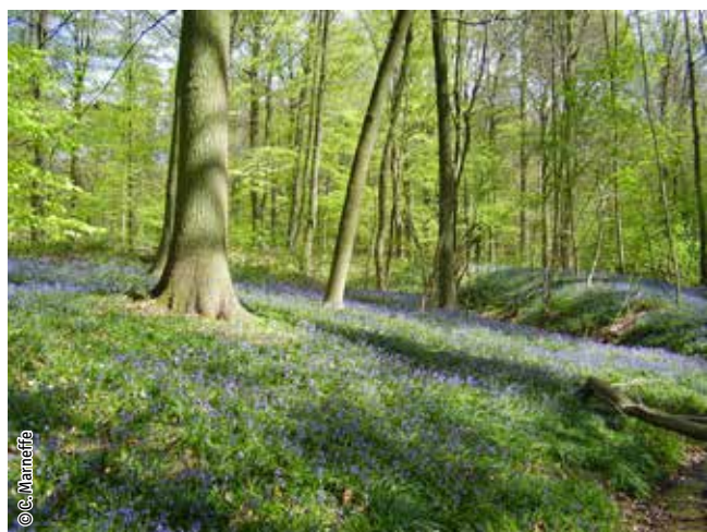
Hêtraie à jacinthe des bois

Un habitat Natura 2000 est un milieu rare, menacé ou remarquable à l'échelle européenne. En Wallonie, ces habitats sont regroupés en unités de gestion (UG) nécessitant des mesures 1 pour les maintenir dans un état de conservation favorable. La liste des principaux habitats Natura 2000 présents dans ce site sont: