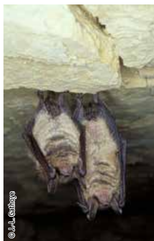
Vespertilion à oreilles échancrées