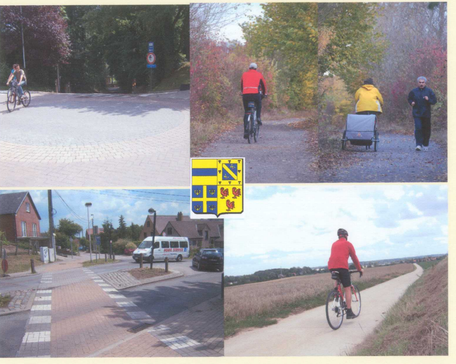
© : Ville d'Ottignies - Louvain-la-Neuve - Service de Cartographie