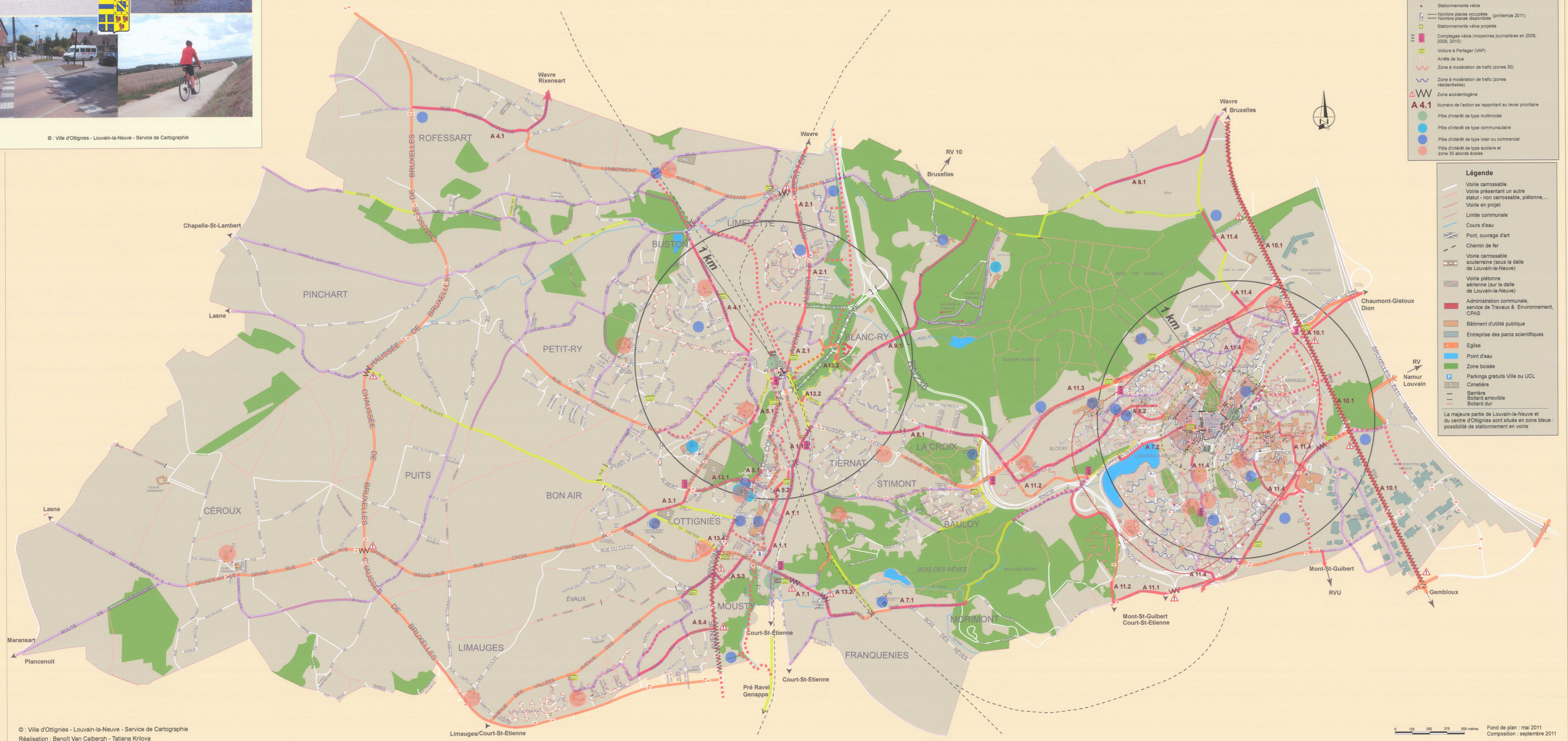
© : Ville d'Ottignies - Louvain-la-Neuve - Service de Cartographie Réalisation : Benoît Van Calbergh - Tatiana Krliva